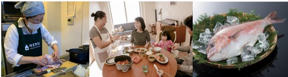
社会実証実験「おうちで食の旅体験」提供イメージ