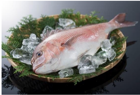
ブランド養殖マダイ「伊勢まだい」