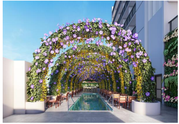
(ワンダークラブ・プール)