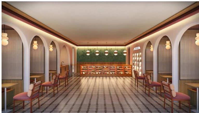
(ワンダークラブ・ラウンジ)

「ルック JTB ワンダークラブ」は、「ワンダークラブ・ラウンジ」「ワンダー・バー」「ワンダークラブ・プール」で構成されており、ポップで遊び心溢れる空間において皆様の記憶に残るサービス・体験を提供します。チェックイン前・チェックアウト後にご利用可能です。