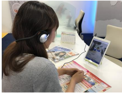
お客様利用イメージ