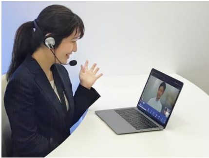
サービス提供イメージ