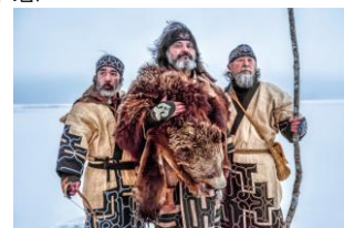
ロストカムイ（イメージ）