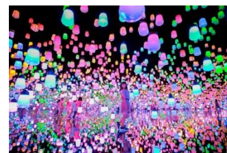
teamLab Exhibition view of MORI Building DIGITAL ART MUSEUM :