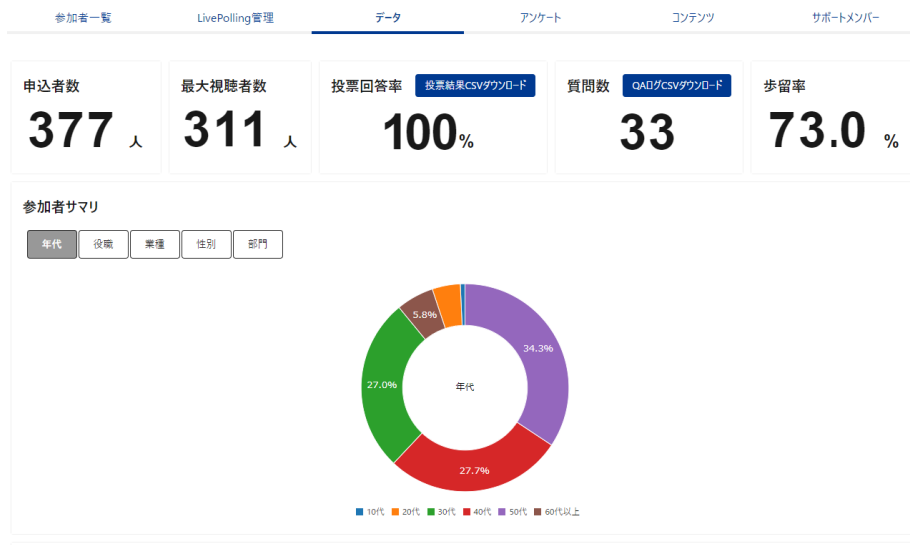
「JCD Event Platform」ダッシュボード画面イメージ

各イベントデータを分析できるダッシュボードをご用意。参加者属性データ、視聴データなどが CSV 形式でダウンロードでき、今後の運営改善にお役立ていただけます。