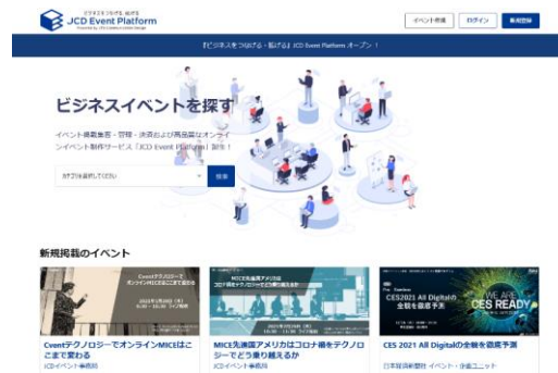
「JCD Event Platform」サイト トップページ

「JCD Event Platform」は、「イベントを通じて企業の課題解決に貢献すること」を目的としたビジネスイベント向けのデジタルプラットフォームです。イベント主催者・サービスプロバイダー・イベント参加者同士のつながりを生み、その後の継続的な関係構築も目指します。