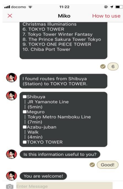
<経路検索機能イメージ>