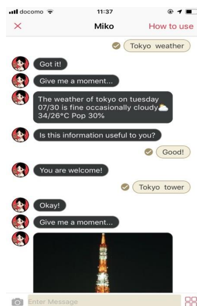
<天気お知らせ機能イメージ>