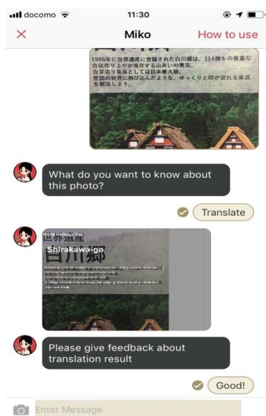
<画像翻訳機能イメージ>

マイクロソフトのクラウドプラットフォーム「Microsoft Azure」を基盤として開発された、AIチャットボットの「Miko」に従来のチャットによる返信機能に加え、画像翻訳機能・経路検索機能・天気情報返答機能を実装し、ユーザーからのより多くの困りごとに関してお応えすることが可能となりました。画像翻訳機能に関してはユーザーが翻訳してほしい画像や写真をチャット画面にアップロードすると、翻訳された画像が返信されます。この機能により飲食店のメニューや街の標識など、身近な情報を気軽に翻訳して調べることができるようになりました。「Miko」との会話を通じて、まだ知らない日本の魅力を感じてください。