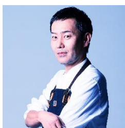
漆器/川口屋漆器店 TAKAYUKI SASAKI