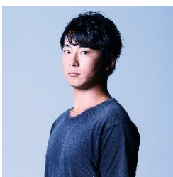
庵治石/石炭会 たぶん、加工。